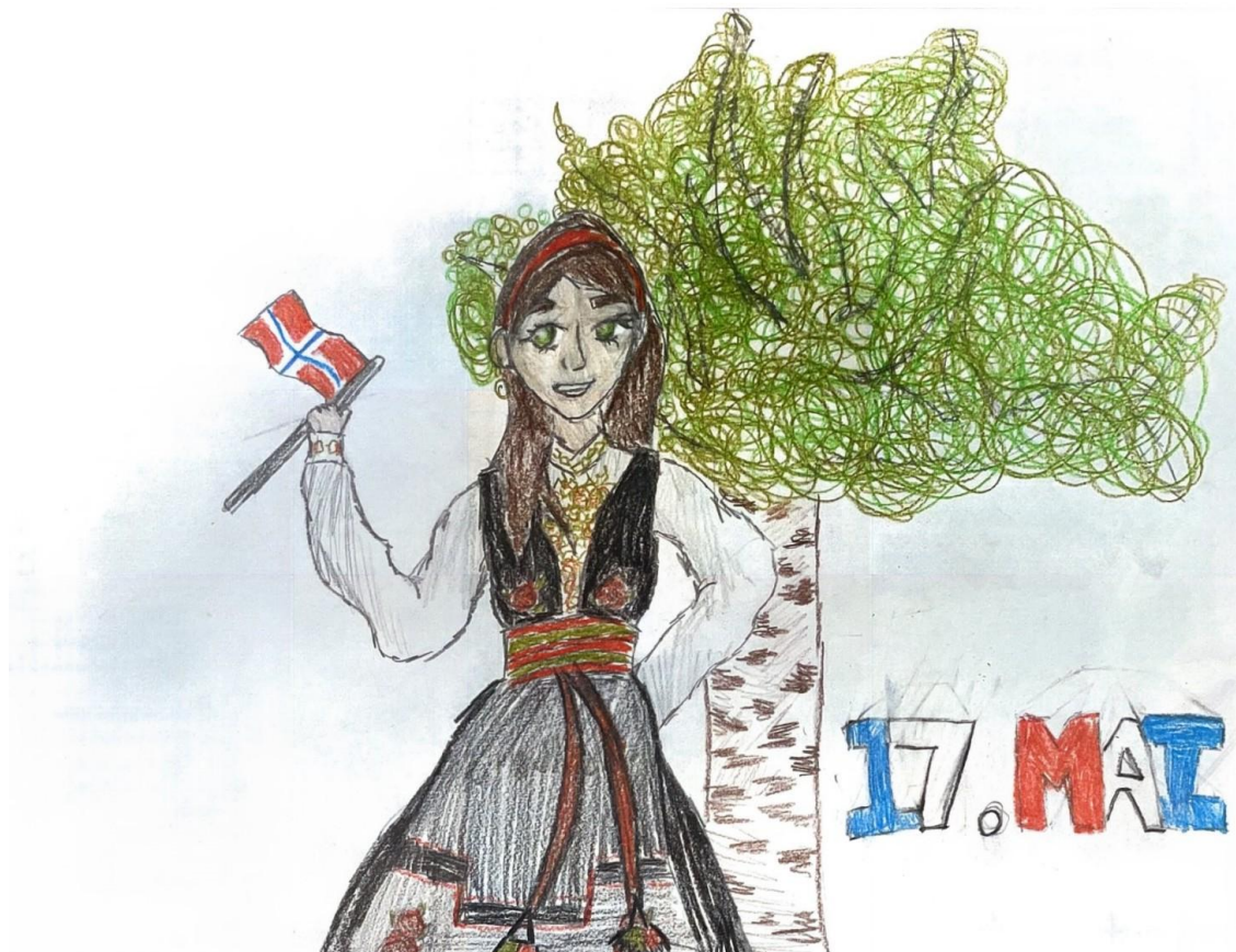
Tegnet av Ysabelle Becares Banico, 7.trinn Svinndal skole