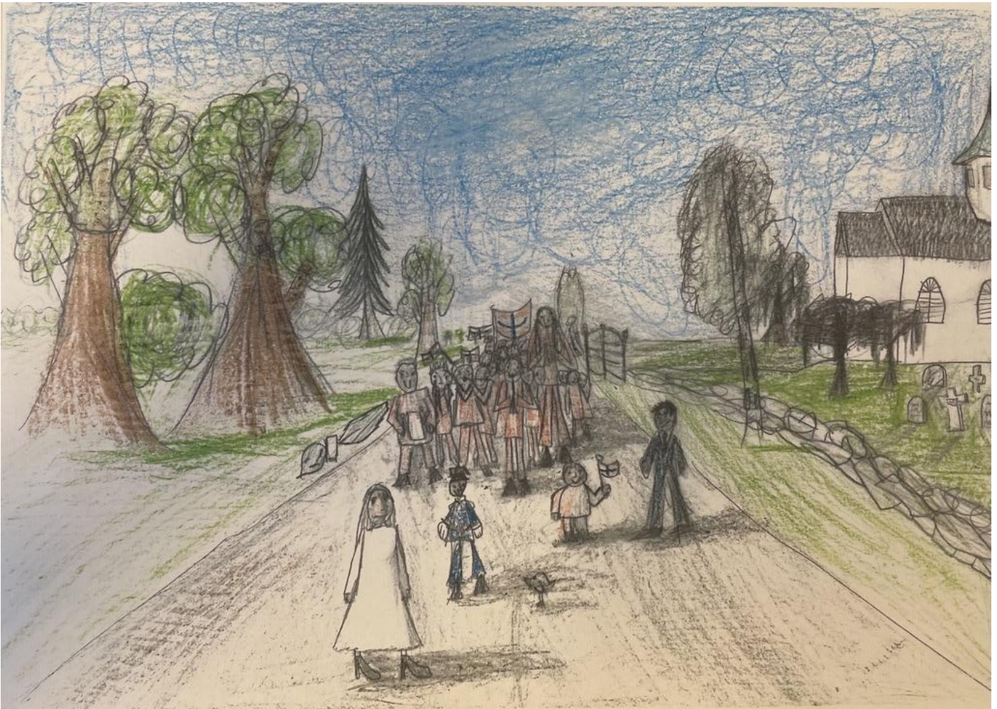
Tegnet av Neo Muus-Dahl, 7.trinn Kirkebygden skole

17. MAI KOMITEENE I SVINNDAL OG KIRKEBYGDEN/VÅK ØNSKER ALLE HJERTELEG VELKOMMEN!